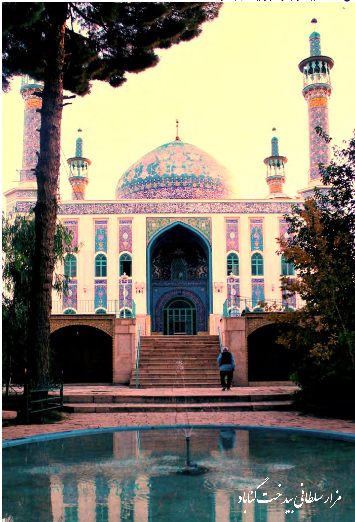
مزار سلطانی بیدخت گناباد