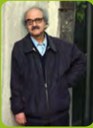
شفیعی کدکنی شاعر روزگار سنت و نوآوری